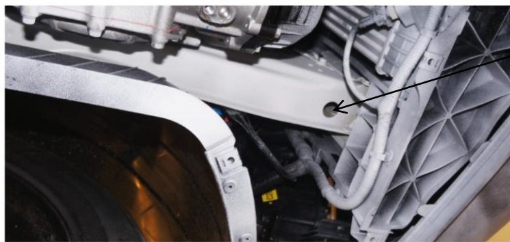
Место крепления кронштейнов

Для правильного позиционирования кронштейнов необходимо их прижать к бортику сбоку и спереди лонжерона.