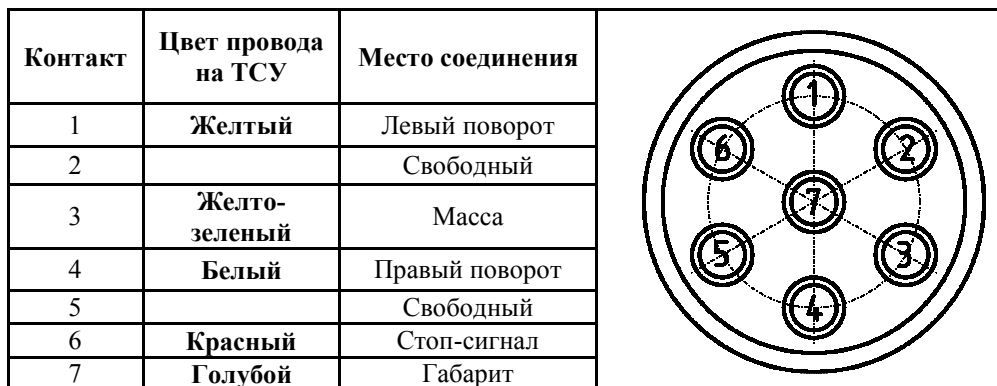
СХЕМА МОНТАЖА ТСУ