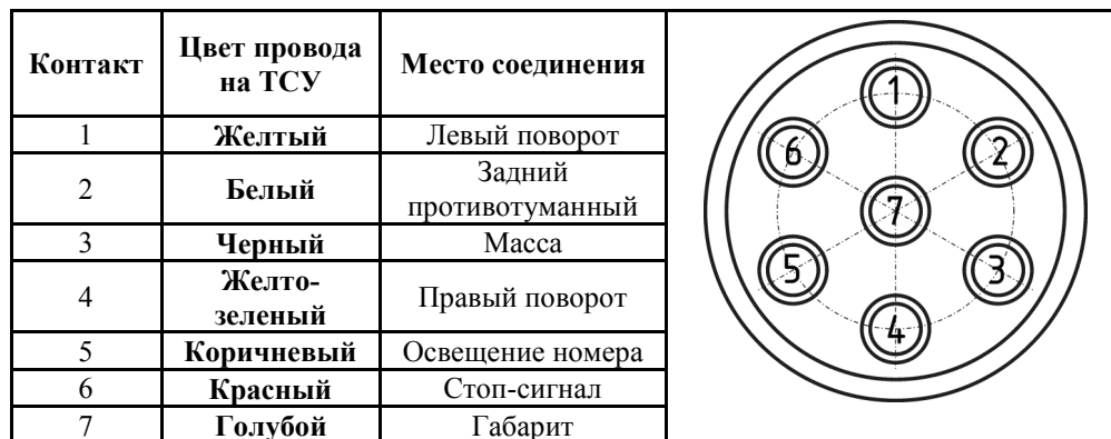
СХЕМА МОНТАЖА ТСУ